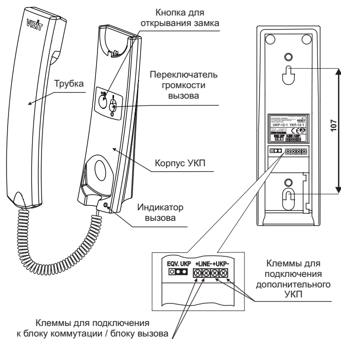
Рисунок 1 - Расположение органов управления и установочный размер